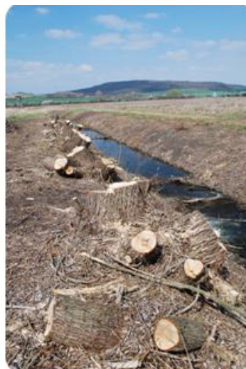
Pohled na Ba popredi začat kvetna 2012