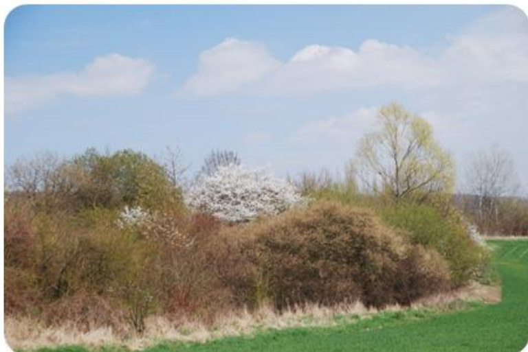
Kvetly vrby a trnky

Napsal uživatel Václav Petříček Pondělí, 04 Červen 2012 06:37