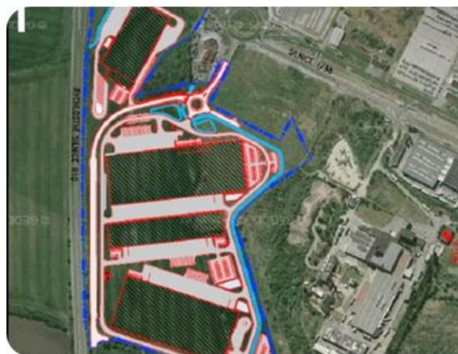
Zamýšlený D+D Park Kosmonosy